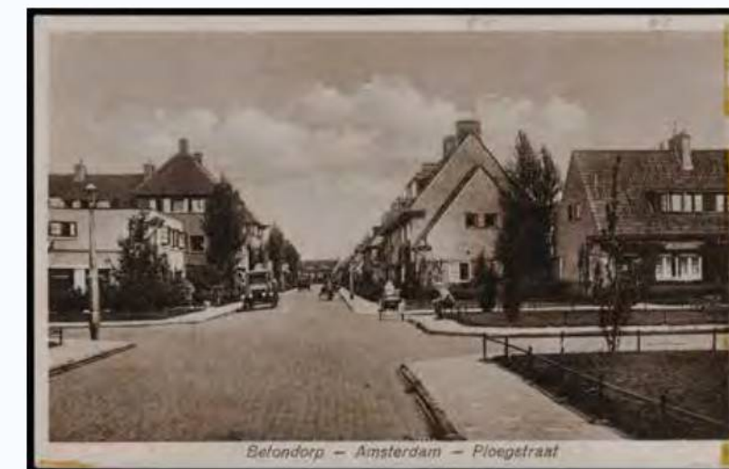
Betondorp - Amsterdam - Ploegstraat